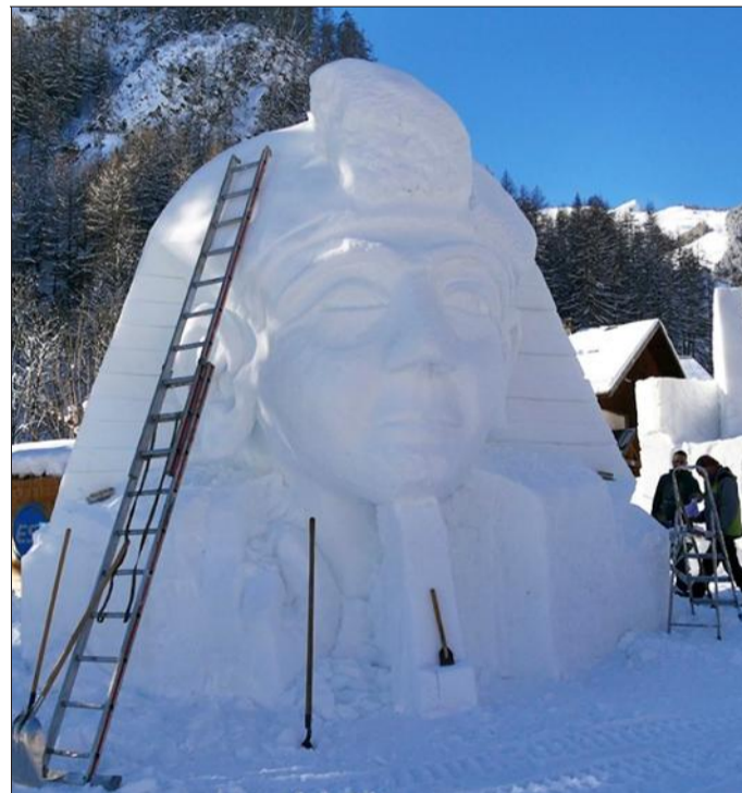
Ph. V Un pharaon qui en impose.